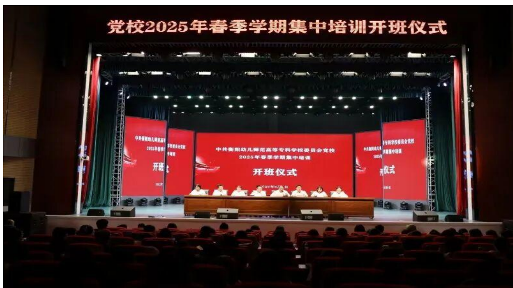
图 6-5 党校 2025 年春季学期集中培训开班