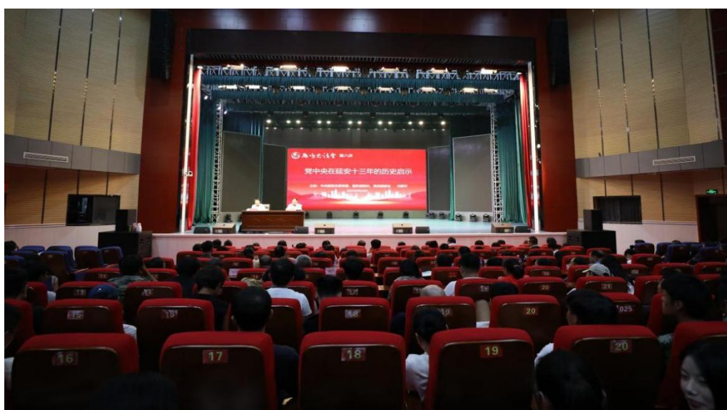
图 4-20 学校开展“雁鸣大讲堂”第八讲开讲