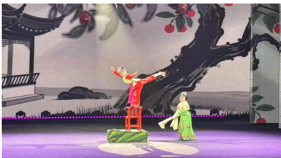
图 1-20 学校学生在第 29 届“中国少儿戏曲小梅花荟萃”展演风采

以创新创业竞赛为牵引，激发创新实践活力。学校深耕创新创业教育，打造“赛事引领、课程支撑、实践赋能”的双创育人体系，常态化开展校级创新创业竞赛。以艺术展演培育为抓手，传承优秀传统文化。学校高度重视艺术教育与文化遗产融合，依托开设的音乐表演专业（祁剧班），将祁剧等传统艺术培育深度融入人才培养体系，通过常态化开展艺术技能训练、校园艺术展演等活动，精准挖掘和培育艺术特长人才。