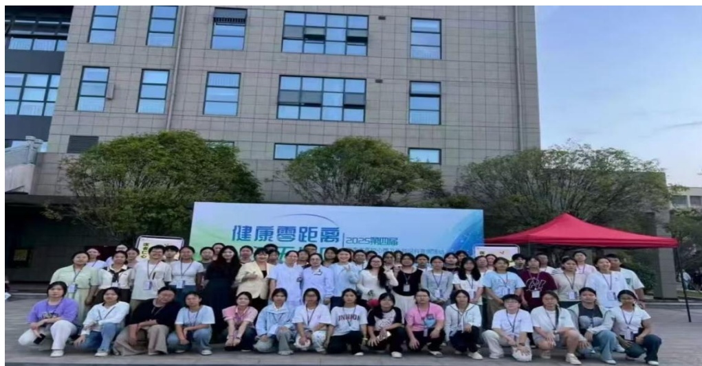
图 1-16 第四届心理卫生知识科普周活动

创新设计“闯关集章”式心理游园会、“浪浪山”心理趣味运动会等。将情绪管理、压力应对、团队协作、沟通信任等心理素质培养目标，巧妙融入“灵珠守护战”、“结界兽默契大比拼”、“水上乾坤”等创意游戏中。学生在欢乐的挑战中直观学习心理知识，有效提升了心理韧性、同理心与合作能力。