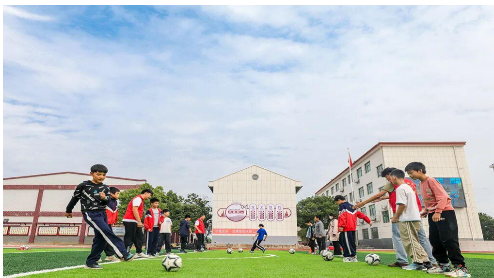
图 2-1 研究团队教师带领孩子们开展趣味足球

该协同模式聚焦政策落地与实际痛点,通过课程、师资、资源的系统性赋能,有效提升了试点学校体育课的开足率与教学质量。这一实践不仅促进了中小學生体质健康与运动习惯养成,也强化了高校师生的实践能力与社会服务意识,实现了高校与基础教育的双向滋养与共同发展,是深化体教融合、助推教育公平的生动范例。