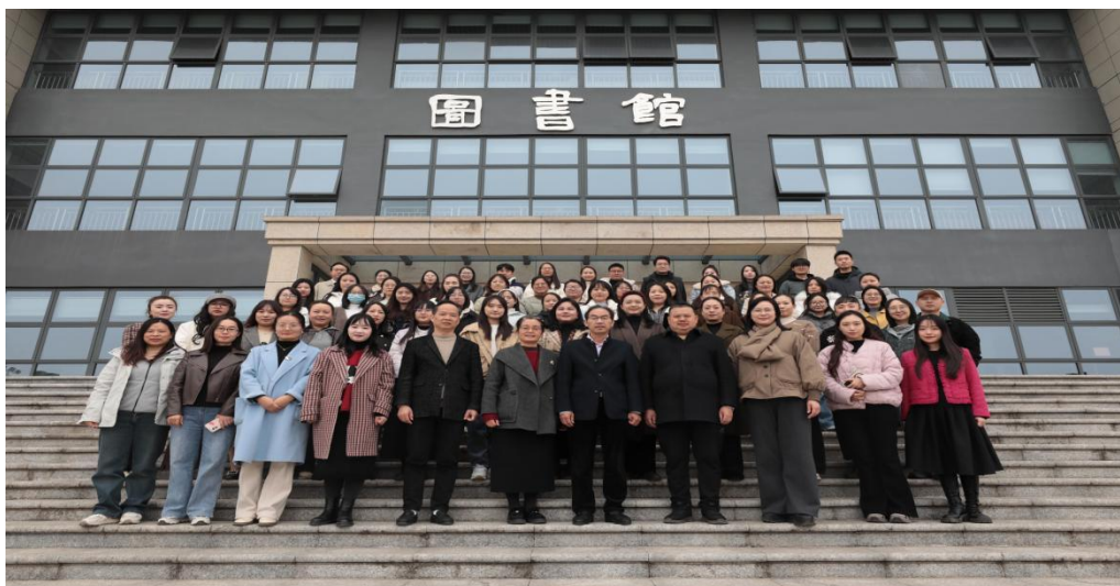
图 1-17 2025 年青年教师教学能力提升训练营青蓝结对合影