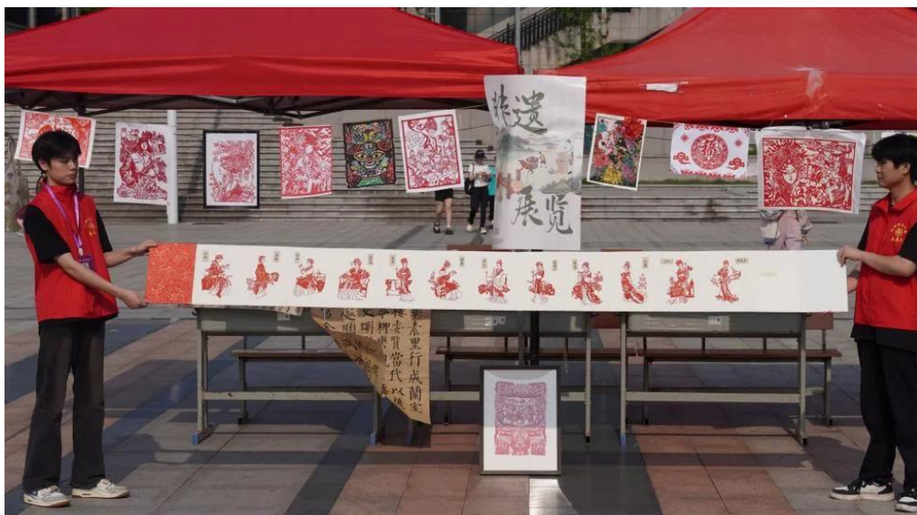
图 4-8 学校学生的剪纸作品