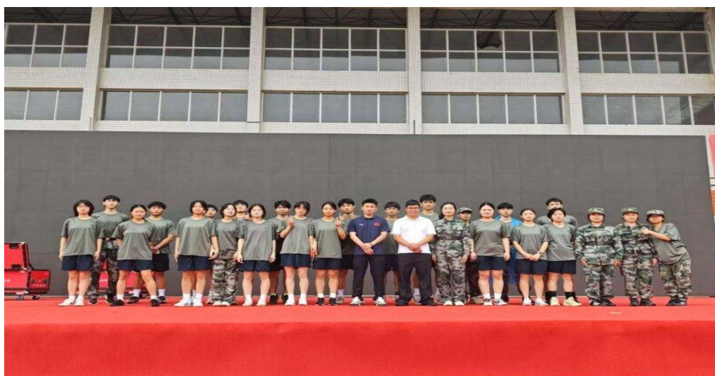
图 1-7 衡阳市 2025 年大学生征兵宣传启动仪式暨军事兴趣类社团军事课目比武竞赛

战术推演与抗压心理训练。引入“数据化评估系统”，通过智能设备监测队员心率、动作标准度等指标，动态调整训练方案。此次比武成绩印证了“以训促征、以赛育兵”的育人成效。学校将持续深化国防教育改革，为强军事业输送更多“文能执笔、武能持枪”的高素质后备力量。