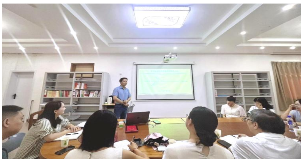
图 1-18 公共基础课教学评价改革与教学经验交流会

本次交流会由教务处精心策划搭建平台，有效整合了两部门的教学实践智慧。通过分享思政课教学评价改革与合班教学经验，促进了部门间的优势互补，为学校进一步优化教学管理、提升课程建设质量提供了有益参考和方向指引。教务处将持续推动此类经验交流活动常态化，助力各学科教学创新，推动学校教育教学改革向纵深发展。