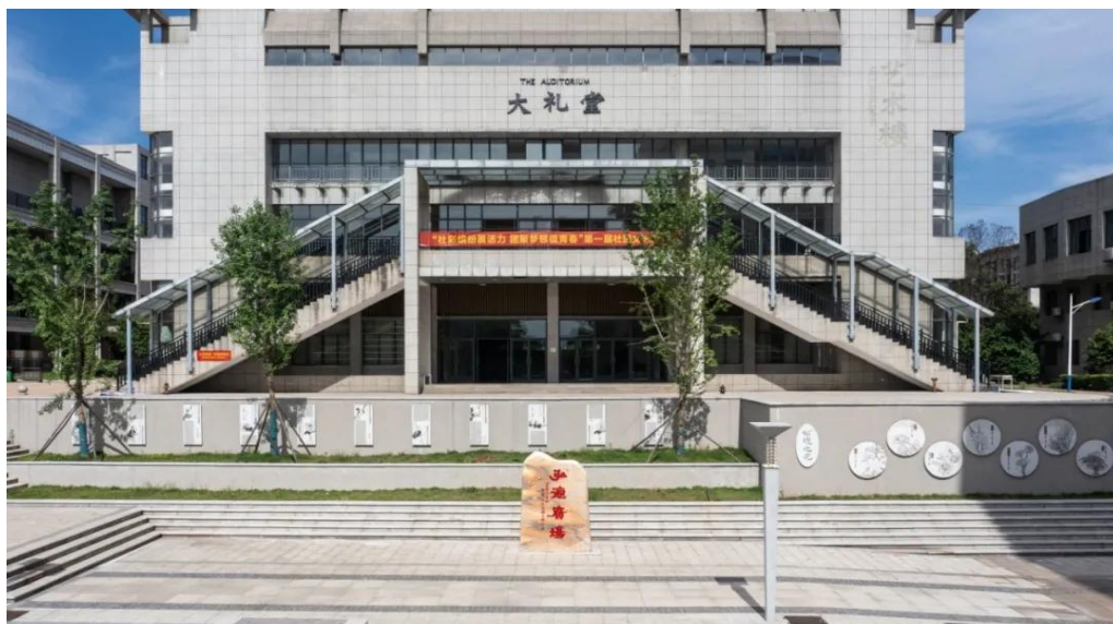
图 4-13 弘德广场师德文化墙

4月23日下午，学校隆重举行“书香代代传，弄潮处处高”2025年楚怡读书行动之读书节启动仪式暨千人诵读活动。1200多名师生代表齐聚弘德广场。千人诵读的磅礴气势不仅丰富了校园文化生活，更强化了师生对湖湘文化的认同感与传承使命感。读书节活动成为弘扬湖湘文化的重要载体，让湖湘文化中“心忧天下、敢为人先”的精神特质融入师生日常，为学校培养兼具文化底蕴与时代担当的人才注入了深厚动力，也为地方文化传承创新贡献了校园智慧。