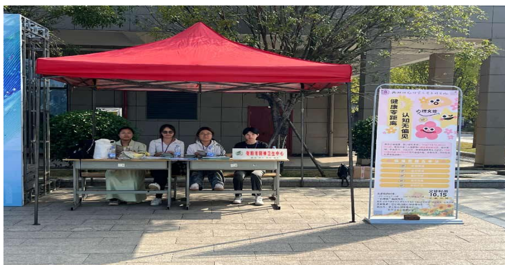
图 1-13 校医合作：心理义诊服务现场

学校持续深化医校协同，引入专业力量，与衡阳市第二人民医院建立稳固的协作关系，邀请焦虑障碍、青少年心理等领域专家进校开展“一对一”义诊与专题讲座。不仅为学生提供了便捷、专业的临床咨询服务，也为学校心理工作队伍提供了宝贵的专业督导与学习资源，筑牢了心理危机预防与干预的“专业防线”。