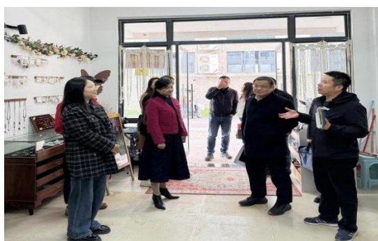
图 1-21 学校创业基地检查

衡阳幼儿师专在 2025 年度成功申报衡阳市创业孵化基地、大学生创业孵化基地。截止 12 月底，基地现有在孵创业实体 33 家，其中注册市场主体的有 14 家，涵盖学生服务、非遗传承、文化创意、美妆护肤、文化传媒、跨境电商等行业，带动就业 50 多人。今后，学校将继续加大对创新创业工作的支持力度，不断完善创新创业体系，推动校创新创业工作取得更大成就。