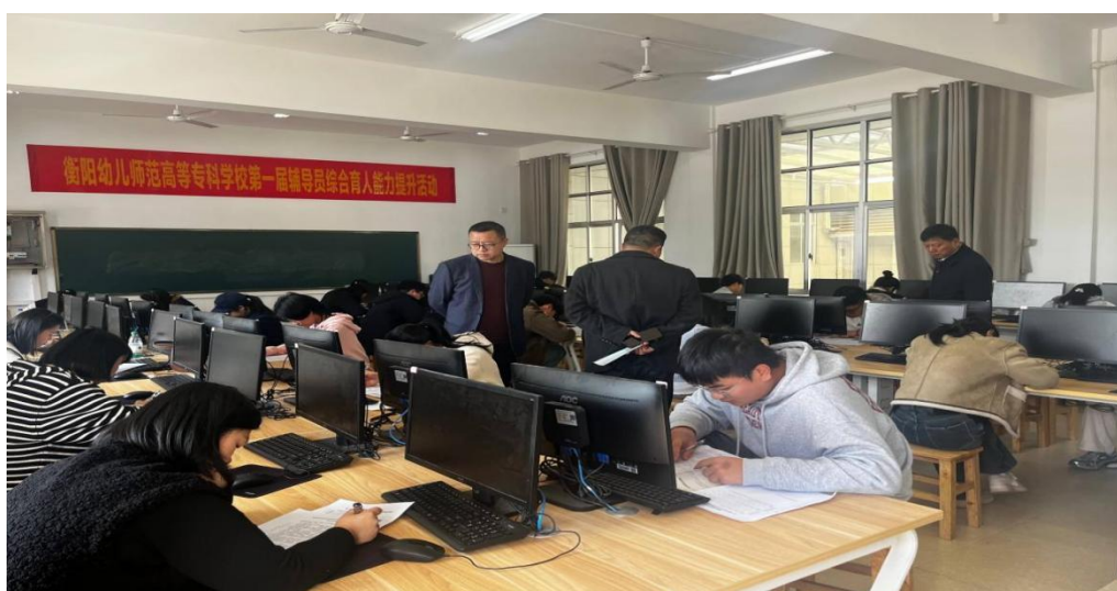
图 1-2 第一届辅导员综合育人能力提升活动

此外，学校同步推进常态化赋能工作，通过开展校内专题培训、组织思政类专项学习等，不断更新辅导员理论知识储备；依托辅导员素质能力大赛、辅导员综合育人能力提升活动等赛事，以赛促学、以赛促练，加速辅导员队伍专业化、职业化发展进程；同时，制定并发放辅导员（班主任）工作手册，明确工作标准、规范工作流程，推动辅导员、班主任工作迈入制度化、规范化轨道，全面提升学校思政育人工作的质量与效能。