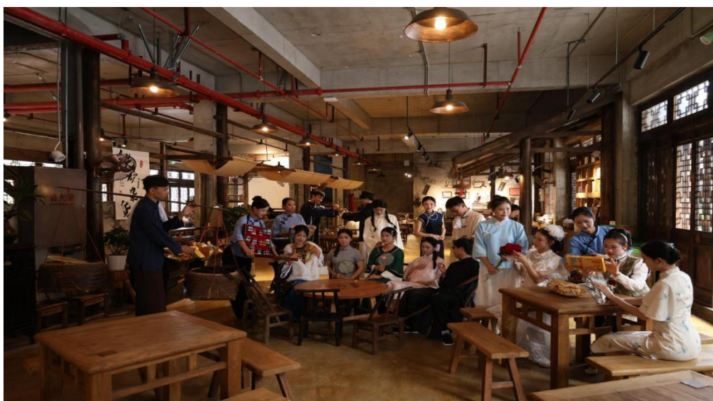
图 4-25 学校 16 位学生在 1944 演出