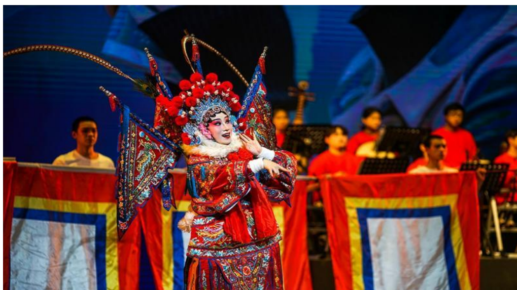
图 4-7 学校祁剧班《梨园花盛开》汇报演出

4月29日，学校学生工作处举办“点亮非遗生活，星光绮梦开场”主题活动。以非遗文化为核心，精心打造非遗作品展览、沉浸式手工体验、娱乐游戏三大板块，让历经千年的非遗文化跨越时空，与青年学子进行深度对话。这次活动让学生真切感受到非遗不是博物馆里的‘老物件’，而是可以亲手创造的鲜活文化！