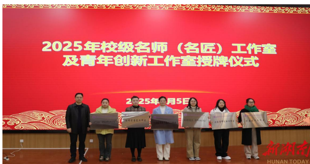
图 4-5 学校名师（名匠）工作室及青年创新工作室授牌仪式现场

工作室的成立与运行，有效激发了教师队伍的创新活力。名师、名匠通过公开课、工作坊、课题共研等形式，传播先进教育理念与精湛技艺；青年教师在参与真实项目、解决教学难题中快速提升能力。此举不仅强化了教师队伍的“传、帮、带”传统，更促进了跨专业、跨系部的交流协作，为学校“内涵发展、转型发展、高质量发展”储备了关键人才，形成了教师专业化成长与学校事业发展同频共振的良好生态。