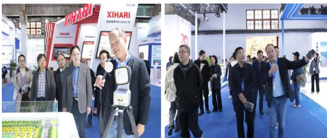
图 6-7 衡阳幼儿师专组织教职员工参观第二届计量仪器装备展

此次组织教职员工参观计量仪器装备展，是衡阳幼儿师专主动对接产业发展、谋划转型提升的重要举措。近距离接触产业前沿不仅让教职员工的知识理念得到了有效更新，更为学校精准调整专业设置、优化人才培养方案、深化校企合作提供了坚实的实践依据，为学校实现高质量转型发展夯实了基础。