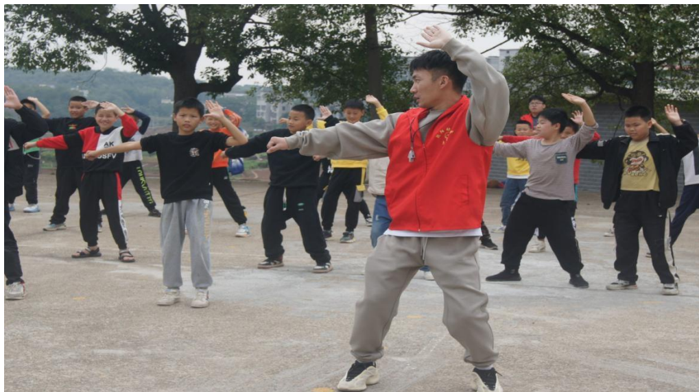
图 2-2 研究团队教师带领孩子们进行武术启蒙