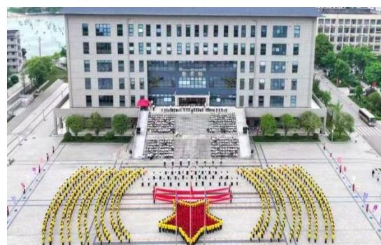
图 4-2 千人诵读活动现场正航拍

活动以《石榴花开处 同心向未来》为主题篇目，组织近 1500 名师生集体诵读，并融合舞蹈《石榴花开》、合唱《世界赠与我的》等文艺节目，通过庄严的仪式感和强烈的视觉冲击，有效激发了全校师生的历史责任感与文化认同感，为全年读书活动奠定了坚实基础。