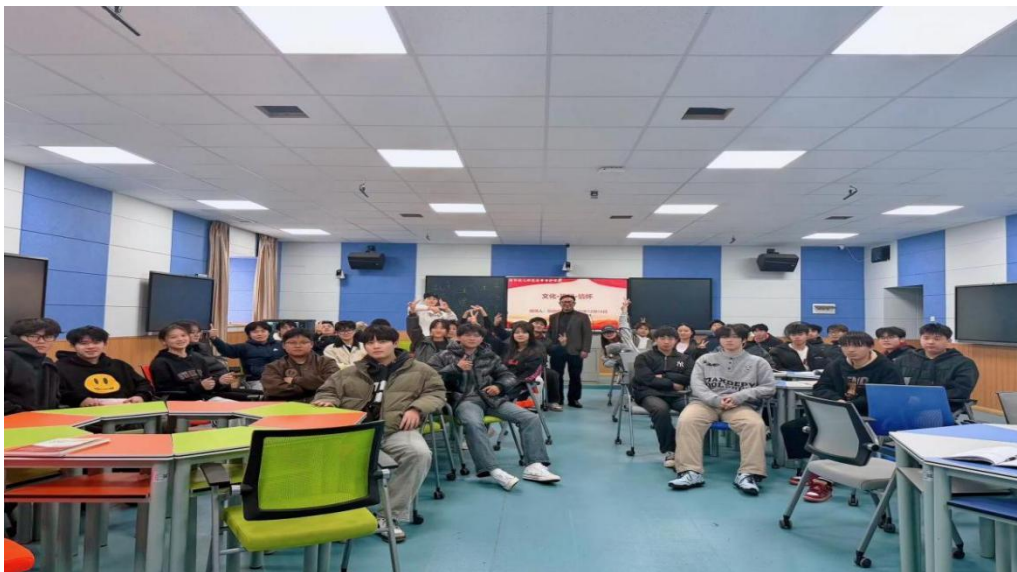
图 1-1 学校领导思政课下课后与学生合影