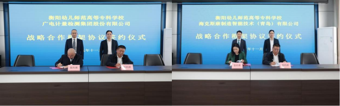
图 2-3 学校与海克斯康签署合作协议 图 2-4 学校与广电计量检测签署合作协议

提升行业影响力。学校以产业园为核心依托，构建协同育人生态：与海克斯康等企业共建实训基地。