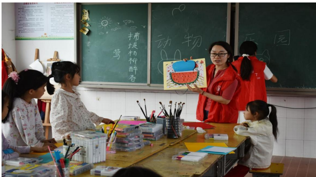
图 3-1 美育点亮乡村课堂国培