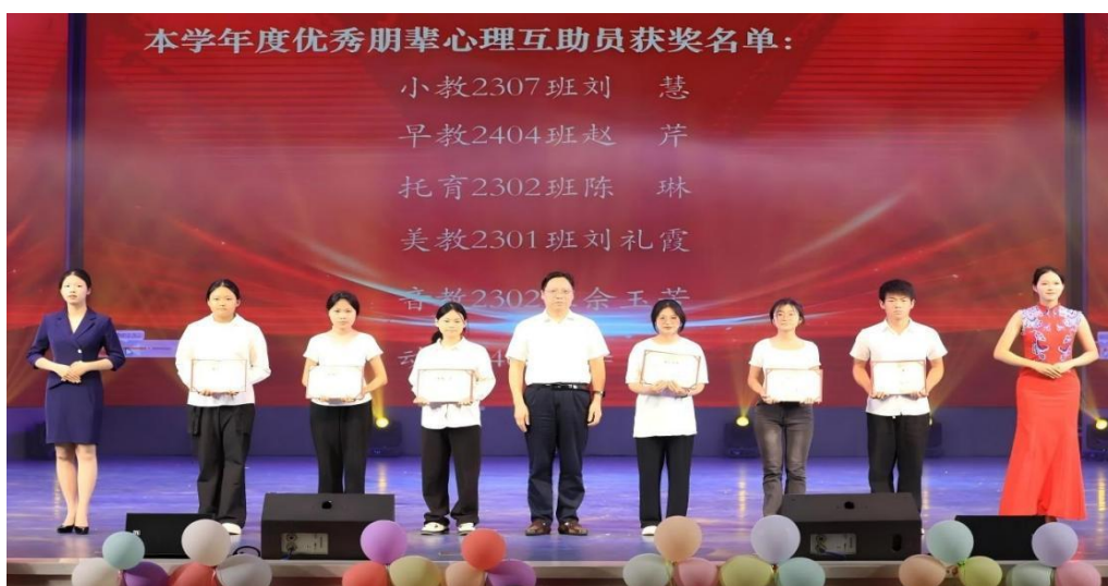
图 1-12 朋辈榜样领航表彰现场

学校持续深化医校协同，引入专业力量，与衡阳市第二人民医院建立稳固的协作关系，邀请焦虑障碍、青少年心理等领域专家进校开展“一对一”义诊与专题讲座。不仅为学生提供了便捷、专业的临床咨询服务，也为学校心理工作队伍提供了宝贵的专业督导与学习资源，筑牢了心理危机预防与干预的“专业防线”。