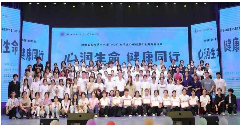
图 1-15 “心润生命·健康同行” 5·25 大学生心理健康节