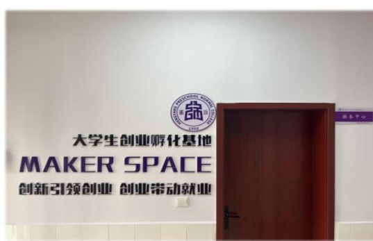
图 1-22 学校大学生创新创业孵化基地