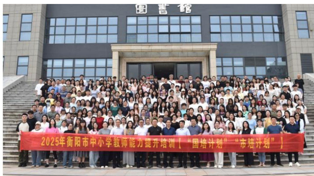
图 4-17 2025 年衡阳市中小学骨干教师能力提升培训合影