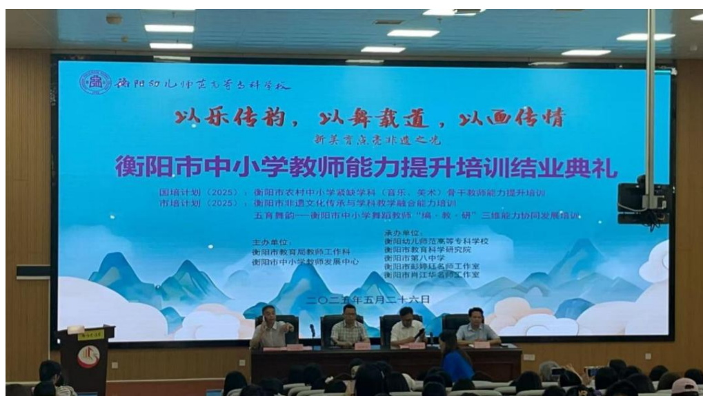
图 4-16 衡阳市中小学教师能力提升培训结业典礼