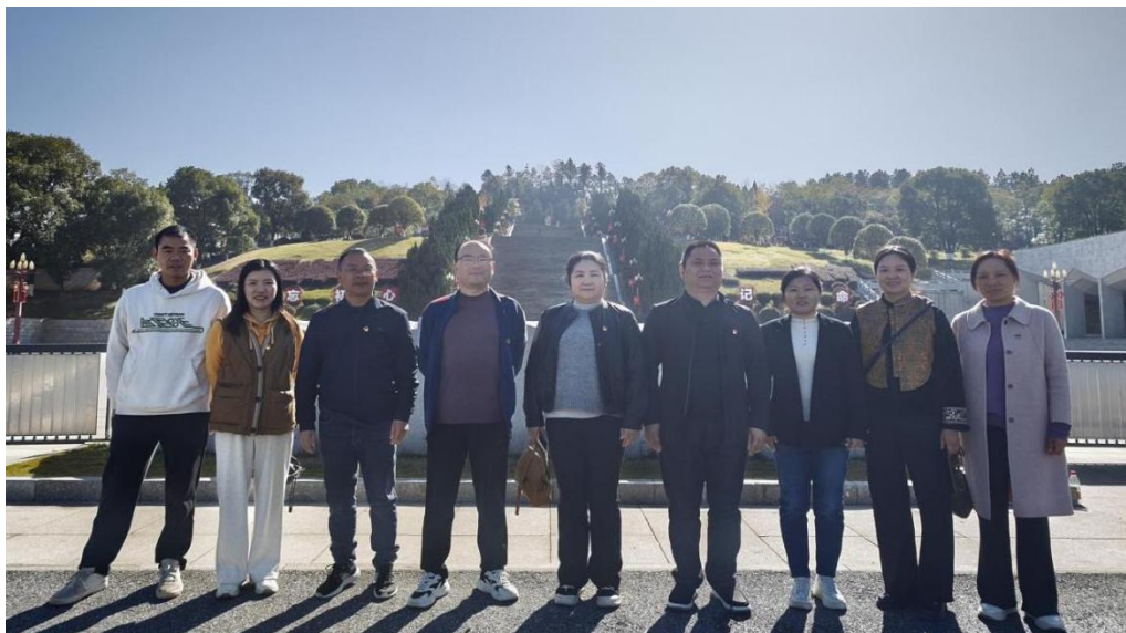
图 4-22 学校党员们在罗荣桓故居留影