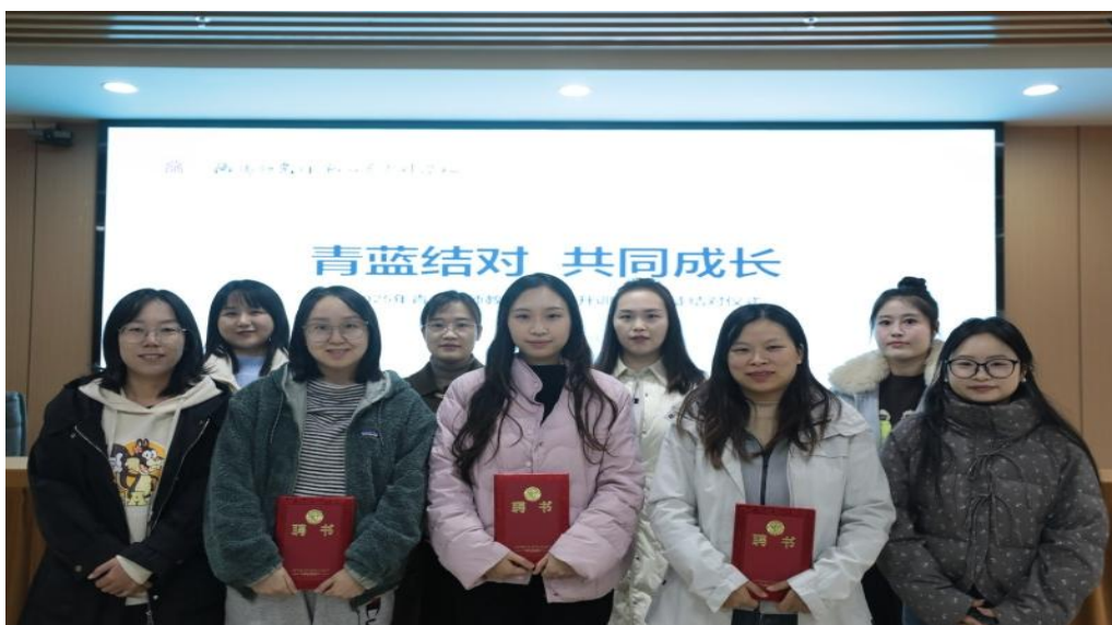
图 6-9 启动“青蓝结对”计划 为青年教师匹配导师团队