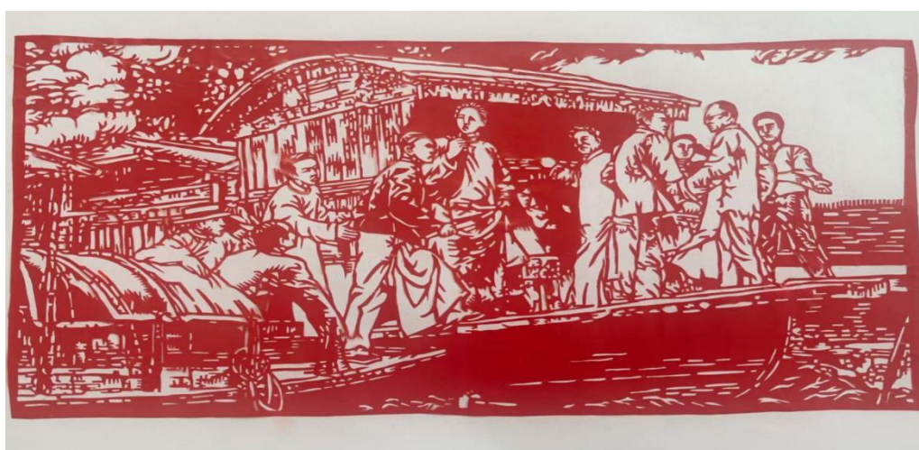
图 1-5 “红色记忆手中塑，革命精神笔下行”手工与文章征集活动