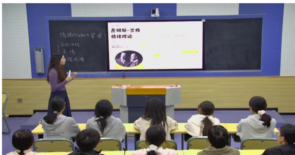
图 1-9 以赛促建，大学生心理健康教育必修课教学大赛

学校以“课程+实践”双轮驱动，依托《大学生心理健康教育》课程、“全校共上一堂心理课”讲座、湖南省高校大学生“健心践行”暑假社会实践调研，构建“理论筑基-实践赋能-全员浸润”的心理健康教育体系。以大学生心理健康教育必修课教学大赛为抓手，构建“赛训一体、以赛促建”的教师发展机制，提升心理健康教育教师教学能力和水平，增强心理健康教育课程的思想性、针对性和实效性。邀请心理专家与学生代表共话“情绪管理”“人际边界”等主题，通过案例拆解、情景模拟等形式，有效澄清了常见心理误区，普及了“心理求助是强者的行为”等科学观念。同步推进“健心践行”社会实践，组织学生深入乡村小学开展心理调研，将专业认知转化为服务社会的实践能力。有效实现心理健康知识普及覆盖率 100%，构建起“人人学心理、处处显关怀”的校园生态，为培育自尊自信、理性平和的新时代青年注入持久动力。