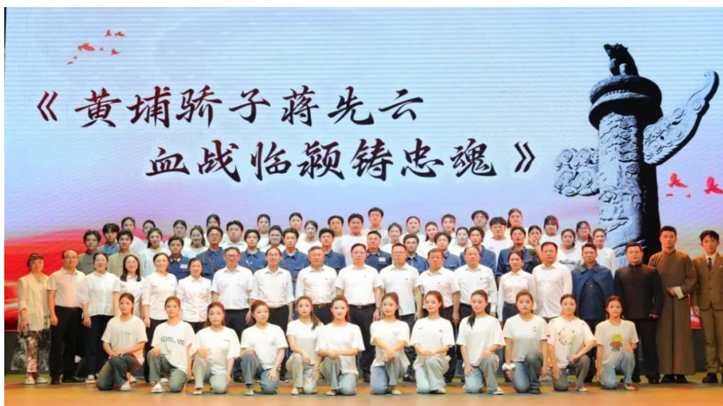
图 4-15 《黄埔骄子蒋先云 血战临颖铸忠魂》在“心社”剧场演出