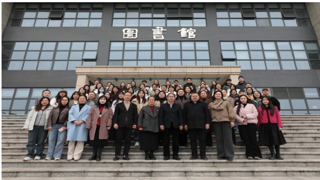
图 6-8 衡阳幼儿师专 2025 年青年教师教学能力提升训练营圆满结束