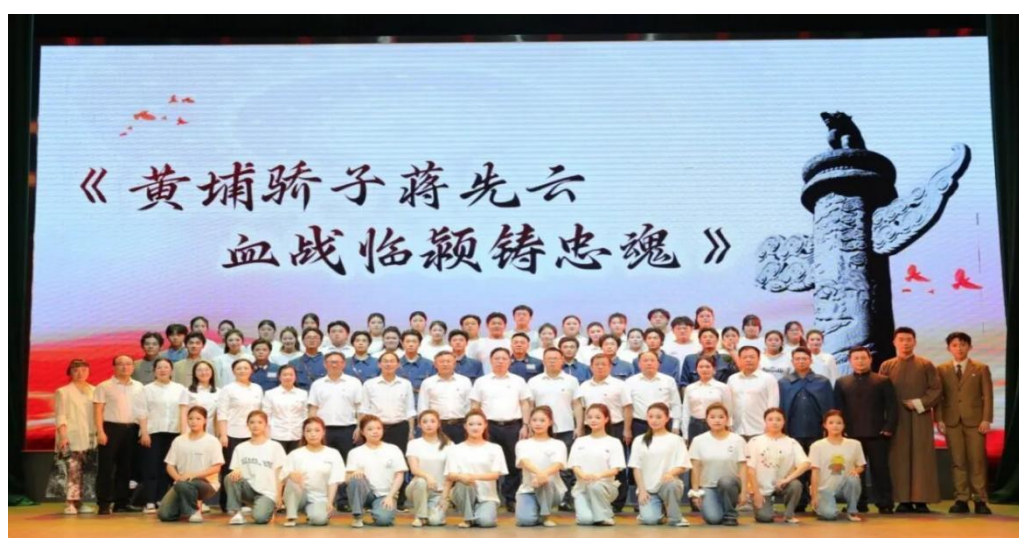
图 1-3 师生创作红色剧目“黄埔骄子蒋先云 血战临颖铸忠魂”

行“双导师制”，专业教师指导艺术表现，思政教师结合史料解析精神内核，使学生在动作编排中深化对忠诚担当的认知。展演环节通过剧场实景还原、多声部合唱与肢体叙事，生动再现蒋先云血战场景，现场观众被“不为名利所动”的革命气节震撼。“心社剧场”品牌项目自实施以来，已孵化“有种信念叫贺恕”“心社故事会”等多部原创剧目，成功实现红色教育从“被动灌输”到“主动传承”的跨越。