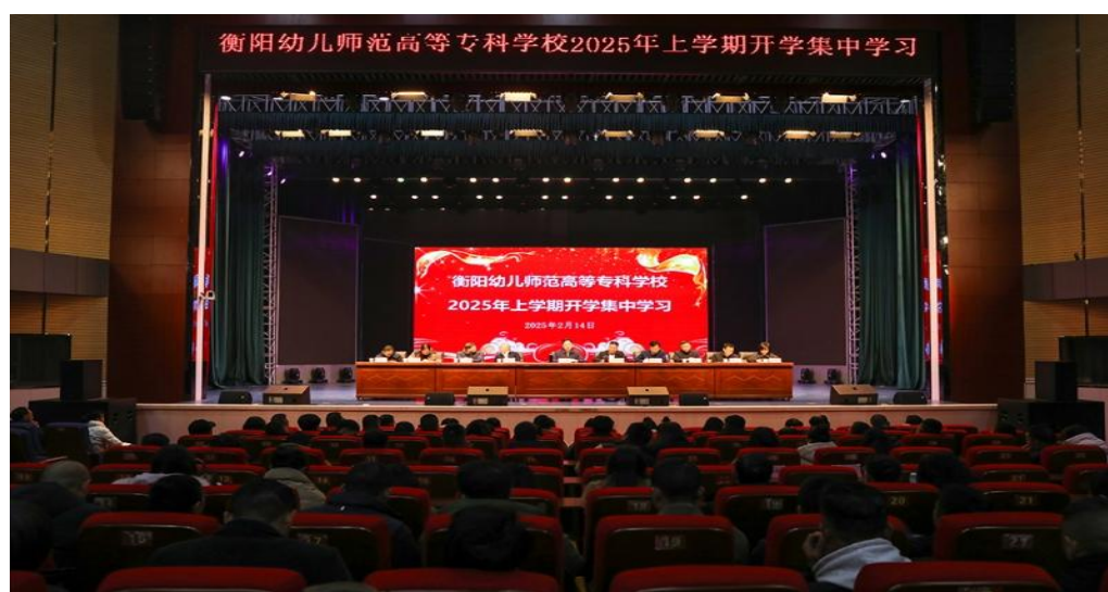
图 6-6 衡阳幼儿师专举行 2025 年上学期集中学习

下午各部门结合工作开展讨论，交流学习心得，把学习内容与实践工作结合起来，提高自身综合素质，切实把思想和行动统一到学校党委全面推进学校转型发展的决策部署上来，充分发挥积极性主动性创造性，服务学校发展新格局。