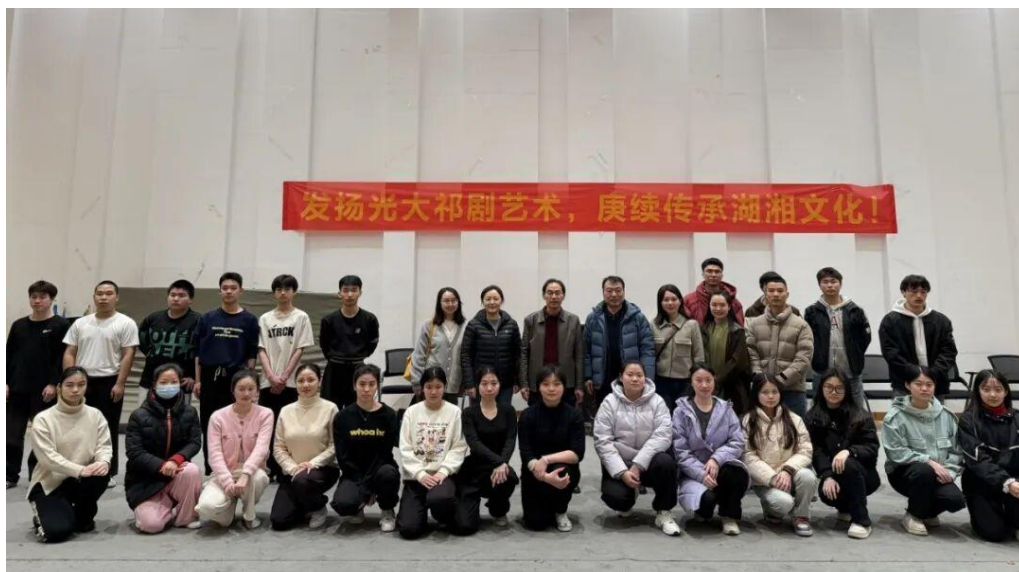
图 4-6 学校音乐舞蹈系学生在衡阳市艺术文化中心实训