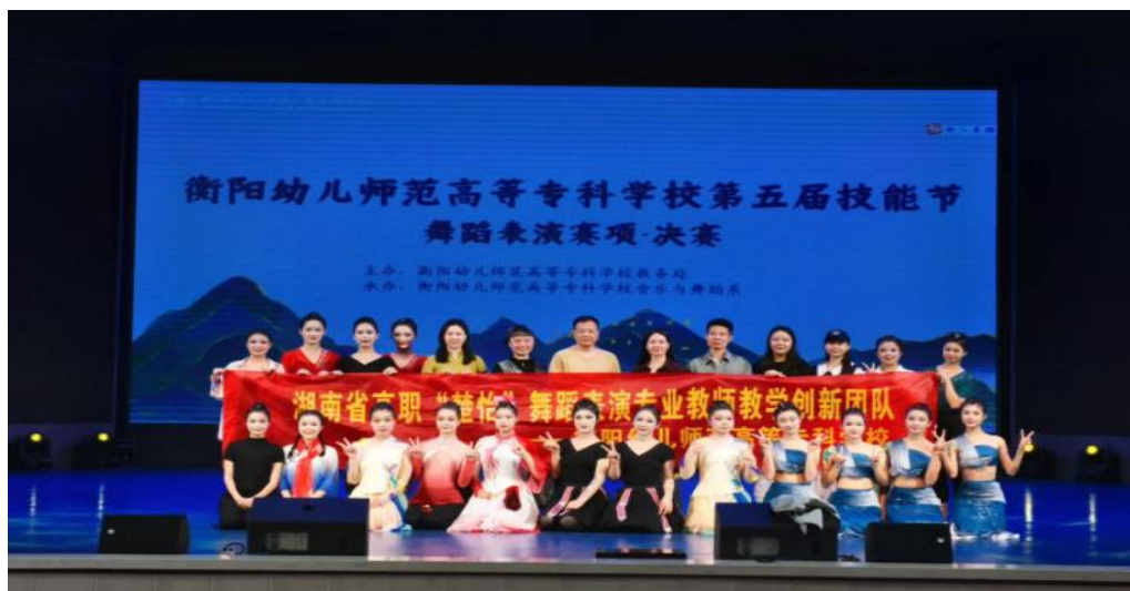
图 1-19 第五届技能节舞蹈表演决赛风采

以创新创业竞赛为牵引，激发创新实践活力。学校深耕创新创业教育，打造“赛事引领、课程支撑、实践赋能”的双创育人体系，常态化开展校级创新创业竞赛。以艺术展演培育为抓手，传承优秀传统文化。学校高度重视艺术教育与文化遗产融合，依托开设的音乐表演专业（祁剧班），将祁剧等传统艺术培育深度融入人才培养体系，通过常态化开展艺术技能训练、校园艺术展演等活动，精准挖掘和培育艺术特长人才。