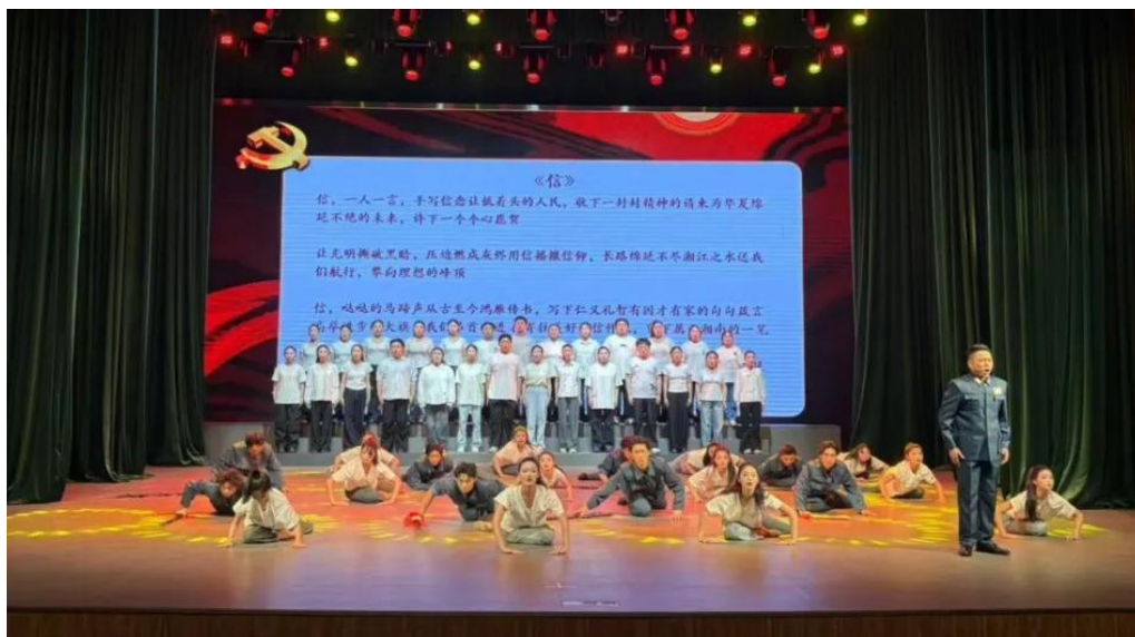
图 4-19 “心社”剧场《黄埔骄子蒋先云 血战临颖铸忠魂》

在历史与文化的碰撞中深化理解。师生们从延安精神与湖湘文化中汲取力量，传承“心忧天下、经世致用”的湖湘特质。