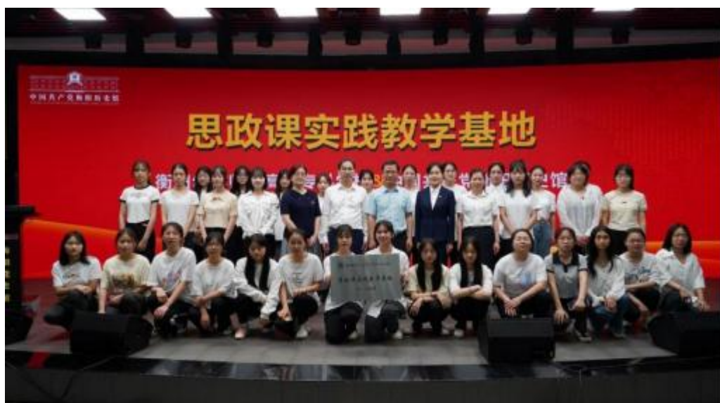
图 4-9 学校与衡阳党史馆举行共建大学生思政课实践教学基地签约仪式