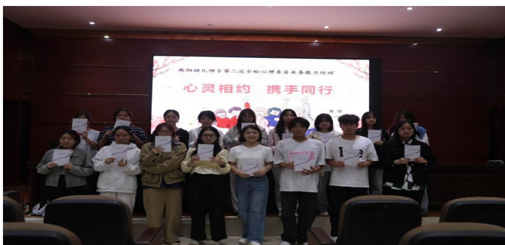
图 1-11 心灵相约，朋辈心理互助赋能培训

心理健康教育工作聚焦朋辈力量培育，以“倾听·陪伴·成长”为核心理念，构建“选拔-培训-实践-激励”四位一体的朋辈支持体系。编制并发放原创《心理知识科普手册》，定期举办心理委员、朋辈心理互助员专题培训及危机干预演练，全面夯实朋辈助人者的专业素养与服务能力。通过先进事迹分享、情景剧演绎及互助案例评选等环节，生动展现朋辈力量在心理疏导、危机预警中的积极作用，形成“互帮互助、共同成长”的校园心理文化生态，有效延伸心理健康教育的温度与广度。