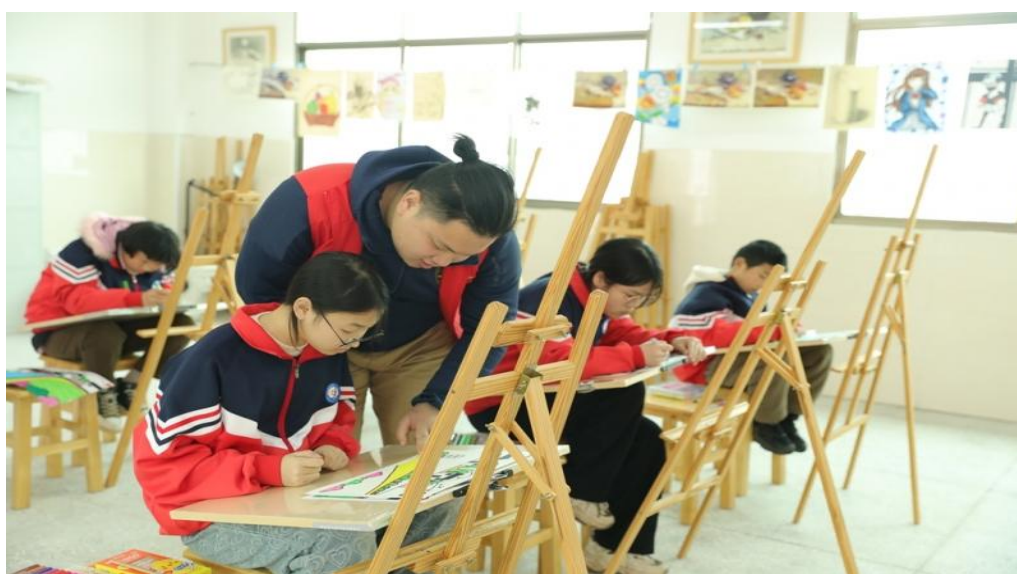
图 3-4 “艺术童伴”留守儿童关爱工程