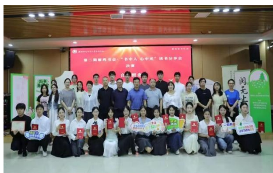
图 4-4 读书分享会颁奖现场

活动伊始，主持人诗意盎然的语言将现场带入浓厚的书香氛围。12 位选手以经典著作为引，献上了一场思想饕餮。他们循着《苦难辉煌》的脉络，带我们重走革命征程，触摸信仰的温度；在余华《第七天》《活着》的字里行间，解读生命的脆弱与坚韧。