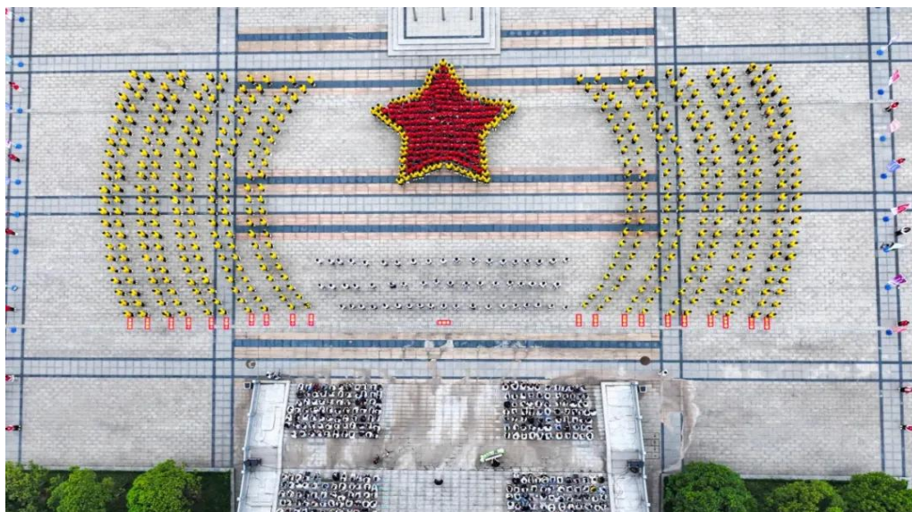
图 4-14 学校学生们在弘德广场演出

5月28日，在黄埔三杰之首、衡阳早期革命团体“心社”发起人之一蒋先云牺牲98周年之际，“心社”剧场第二期心社故事会《黄埔骄子蒋先云 血战临颖铸忠魂》成功开讲。党委书记李来清，党委副书记、校长邓昌大及其他校领导，所有中层干部，各党（总）支部党员，各系学生代表一同观看。