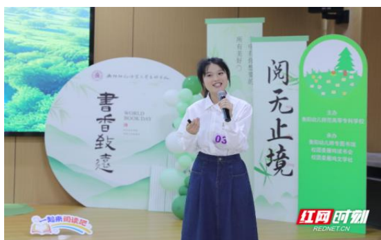
图 4-3 雁鸣书会一等奖获奖选手读书分享

雁鸣书会作为学校精心打造的楚怡读书行动品牌活动，不仅为阅读爱好者搭建了展示自我、交流思想的优质平台，更为学校书香校园建设注入了强劲动力。本次活动由校宣传统战部、学生工作处、图书馆和校团委共同主办。