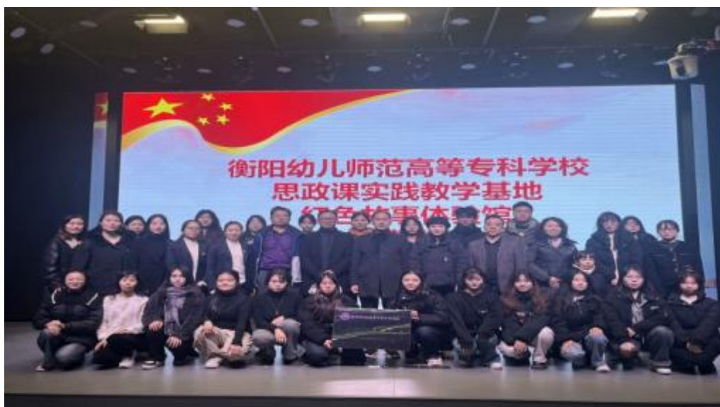
图 4-12 学校与与红色山林航天科普基地举行共建思政课实践教学基地签约

校内湖湘红色阵地：校园文化阵地建设坚持守正创新，以文化人，全力打造三大文化阵地。一是将雁鸣大讲堂打造成传播湖湘文化的新阵地。学校雁鸣大讲堂是一个集思想教育、先进文化与理论研讨于一体的文化阵地，一个思想与文化碰撞交融的平台，承载着传播前沿知识，传递时代声音的重任，学校广邀名家大师来大讲堂开展“湖湘”文化专题讲座，目前已举办讲座和论坛9次。二是将弘德广场打造成湖湘文化传承与师德精神弘扬的新地标。广场东侧的师德文化墙以“弘师德、传师风、育新人”为内核，设“师德之范”“师德之花”“师德之颂”三大板块，分别展现教育榜样、高洁品格与赞颂师者。这里已举办多场特色文化活动，让师生于观瞻赏鉴中悟初心、传新风，使湖湘文化基因与师德精神在校园生生不息。三是深挖百年红色文化和湖湘文化，将“心社”剧场打造成艺术专业的展示舞台、思政教育的创新舞台和红色衡阳的传承舞台。