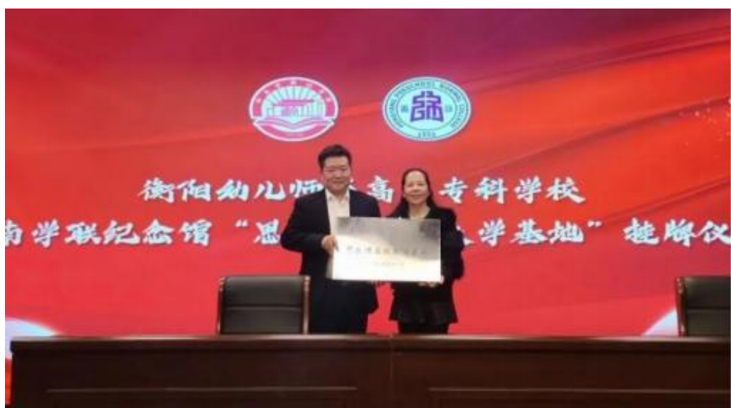
图 4-10 学校与湘南学联纪念馆举行共建思政课实践教学基地签约暨挂牌仪式