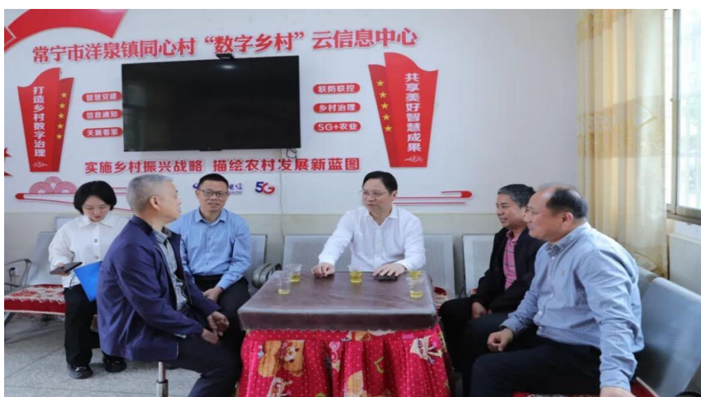
图 3-3 学校党委书记听取同心村乡村振兴工作情况介绍