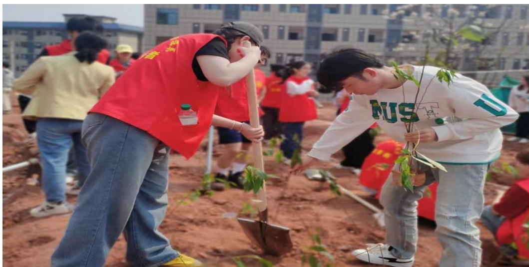
图 1-14 “绿色校园·党员先行”主题植树劳动教育活动