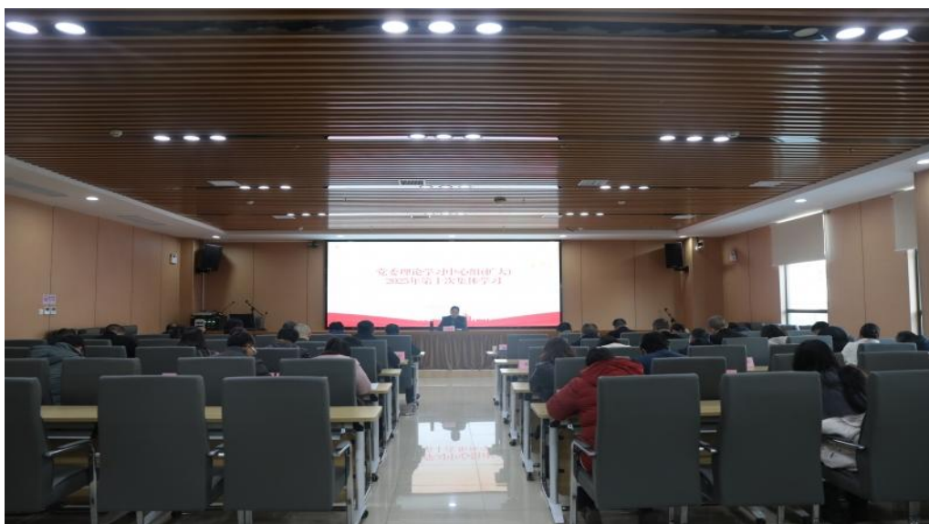
图 6-2 学校党委召开深入学习领会党的二十届四中全会精神集体学习会