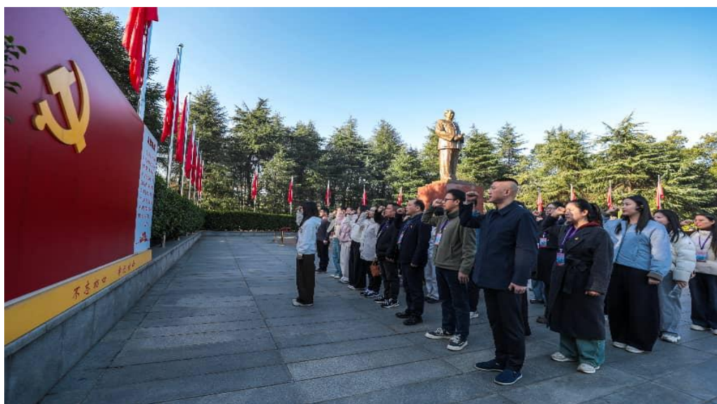
图 6-4 学生支部党务干部和 2025 年新发展教师党员履职能力培训班重温入党誓词