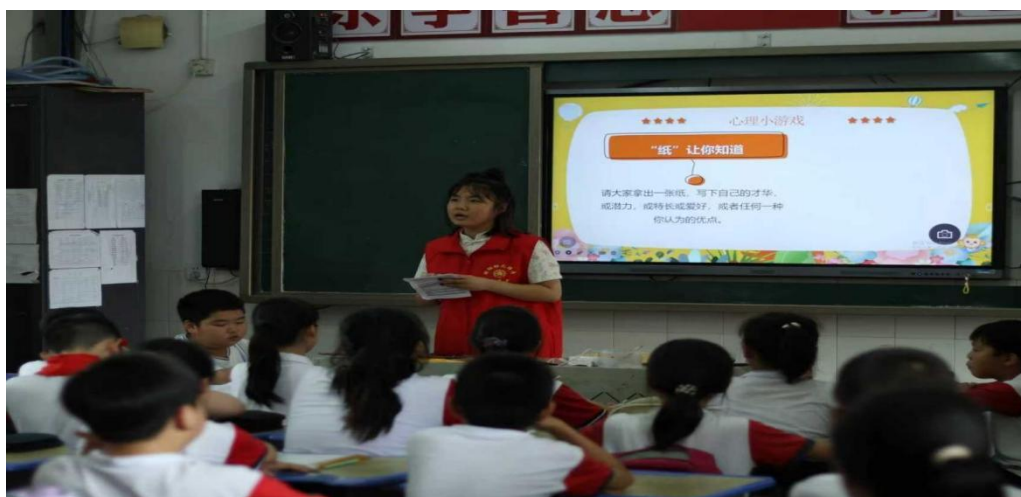
图 1-10 组织学生深入农村开展“健心践行”暑假社会实践调研

心理健康教育工作聚焦朋辈力量培育，以“倾听·陪伴·成长”为核心理念，构建“选拔-培训-实践-激励”四位一体的朋辈支持体系。编制并发放原创《心理知识科普手册》，定期举办心理委员、朋辈心理互助员专题培训及危机干预演练，全面夯实朋辈助人者的专业素养与服务能力。通过先进事迹分享、情景剧演绎及互助案例评选等环节，生动展现朋辈力量在心理疏导、危机预警中的积极作用，形成“互帮互助、共同成长”的校园心理文化生态，有效延伸心理健康教育的温度与广度。