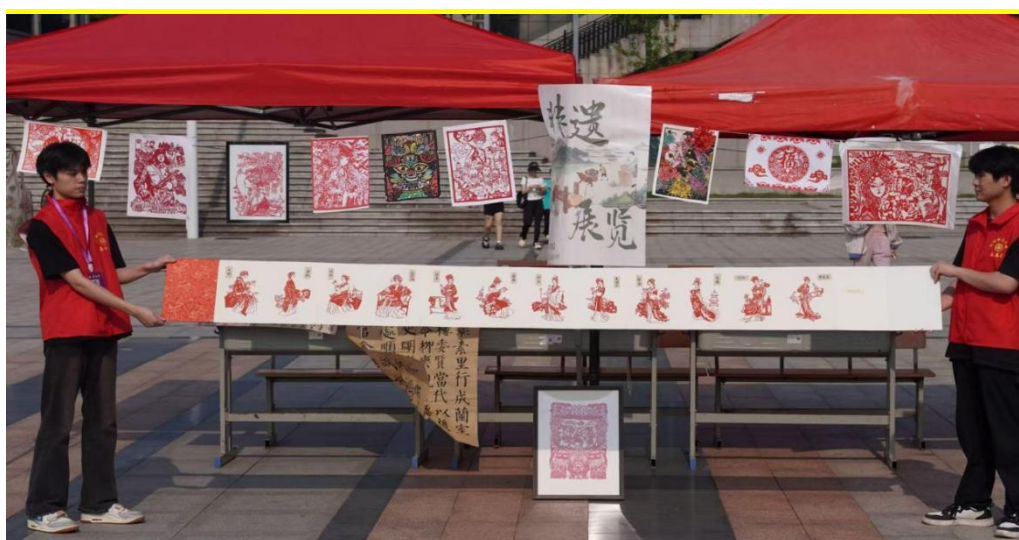
图 1-4 “点亮非遗生活，星光绮梦开场”主题活动

焦文化传承、审美培育等核心育人场景，切实提升学生的文化自信与传承自觉；二是“寝室文化节”系列活动，围绕环境美化、文化塑造、凝聚力提升等关键方向，以寝室装扮评比为特色环节，引导学生在协作共建中涵养集体意识与优良品德；三是“红色记忆手中塑，革命精神笔下行”手工与文章征集活动，借助剪纸、泥塑、征文等创作形式，让学生在回望革命历史、致敬英雄事迹中厚植红色信仰。