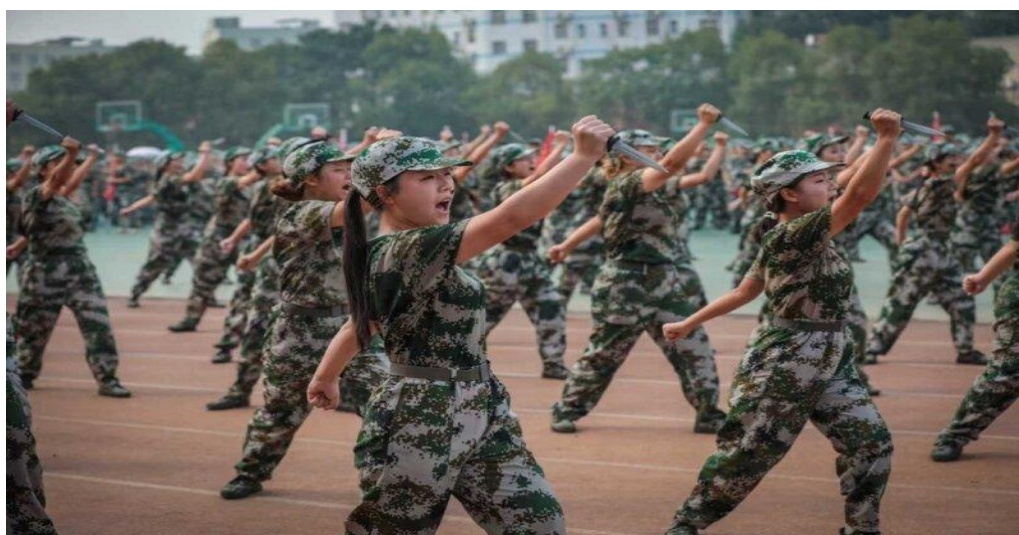
图 1-8 学校自训队队员展示“匕首操”