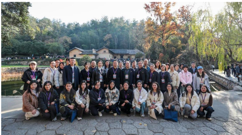
图 4-23 学校党员们在韶山留影