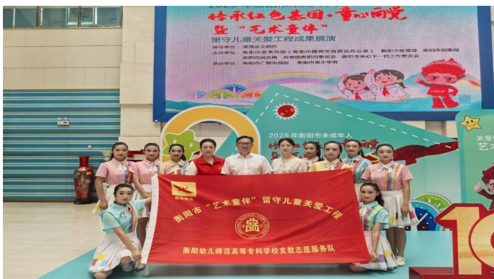
图 3-5 “艺术童伴”留守儿童关爱工程支教帮扶活动

自 2020 年 11 月以来，衡阳幼儿师范高等专科学校利用自身优势，充分发挥高等职业院校人才培养和社会服务功能，积极开展“艺术童伴”留守儿童关爱工程支教帮扶活动，全面助力乡村教育振兴。组建数支“衡阳群众”支教队伍，选派艺术专业师生赴衡南县松江联合学校长岭校区、衡南县硫市联合学校文昌校区、衡南县茶市联合学校、常宁市洋泉镇同心村童星幼儿园和杉树完小、衡阳县曲兰镇高汉完小等结对乡村学校开展现场教学活动，指导结对乡村学校成立舞蹈、声乐、古筝、吉他、美术、书法、手工制作等各类艺术兴趣小组 11 个并开展活动，培养留守儿童艺术兴趣爱好，帮助结对学校编排各类晚会节目并组织参演。