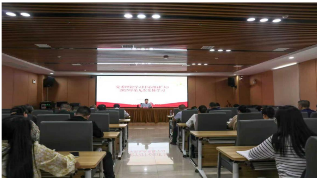
图 6-1 学校党委召开深入学习《习近平谈治国理政》第五卷集体学习会