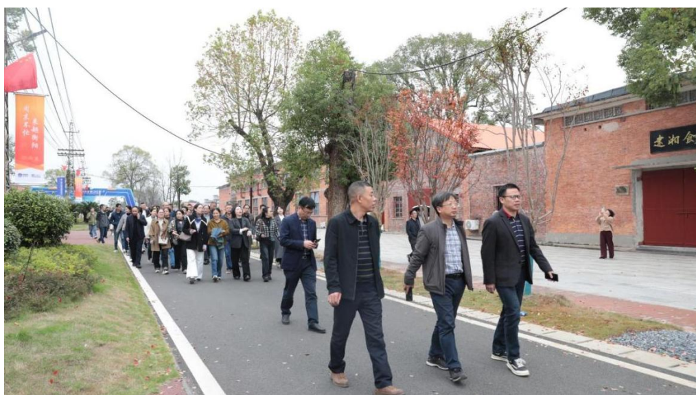
图 4-21 学校组织党员前往建湘工业园开展主题党日活动

1944 年的老城旧肆里，学校音乐舞蹈系 16 位学生撑起的演出在青砖灰瓦间启幕。学生们把当地老茶馆的烟火气搬来，让祁剧的水袖扫过米糕的甜香，让渔鼓的韵律裹着湘绣的针脚。他们演的是祖辈的营生、巷弄的吆喝，是 1944 年里，地域文化没被硝烟吹散的模样。传承从不是复刻古旧，而是让年轻的声音，把地域的魂，唱进每个当下的烟火里。