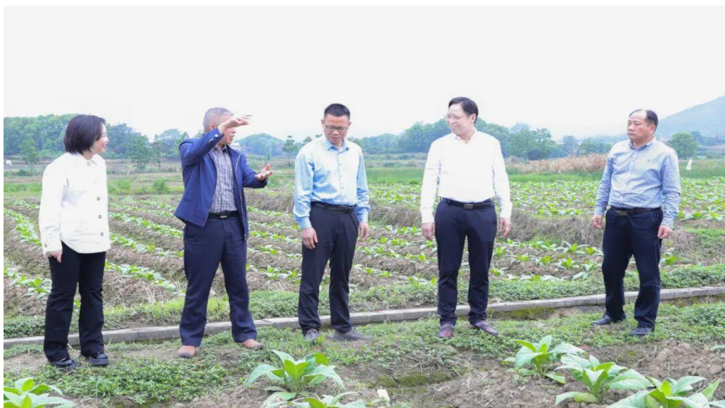
图 3-2 学校党委书记深入田间地头查看同心村农作物种植情况