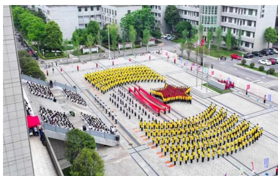
图 4-1 千人诵读活动现场侧航拍

系学子们以饱满的热情、优美的舞姿，时而如同“石榴籽”般紧紧相拥，时而跳跃旋转，把民族舞蹈的独特魅力与各民族团结奋进的精神面貌展现得淋漓尽致，大合唱《世界赠予我的》将本次活动推向高潮。